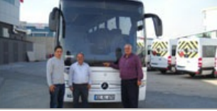
Konya Turizm'den yeni bir araç yatırımı